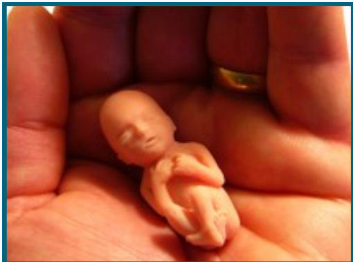
Modeli i fetusit 10-javësh